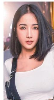
ฟ้าใส แสนดี

โควิดป่วน กรม. 'วิษณุ-ศักดิ์สยาม-ตรีนุช'ขอกักตัว 14 วัน 'กัลยา'ก็ลาไปตรวจหาเชื้อ เผย'บิกตู-ชัยวุฒิ'สอ